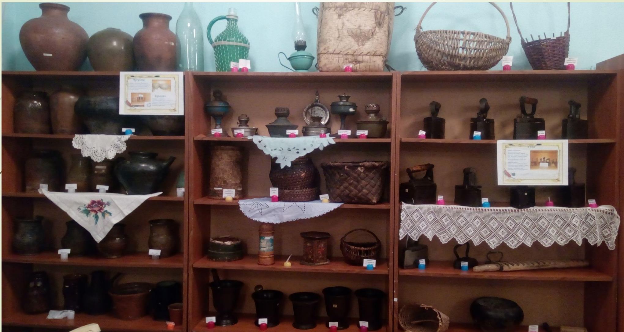
Музей МАОУ ДО «Дом детского творчества» Аромашевского района