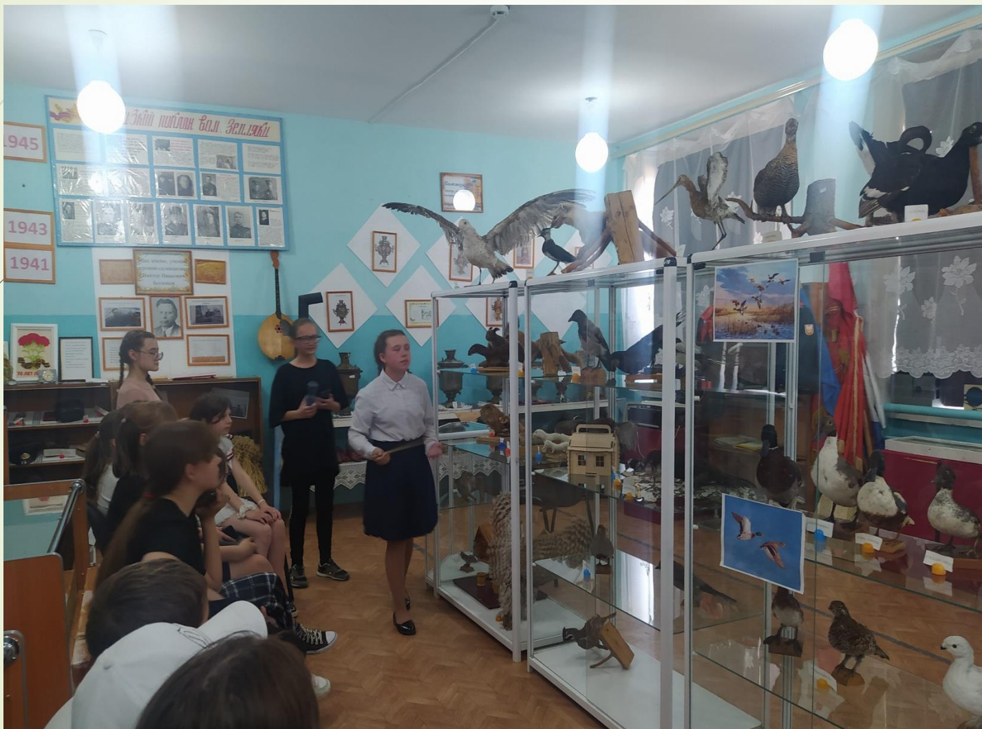
Музей МАОУ ДО «Дом детского творчества» Аромашевского района